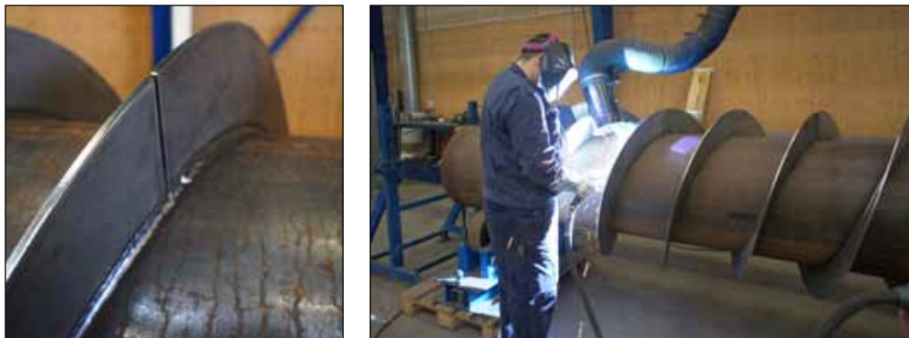
Sneglerotor fremstillet efter kundetegning.