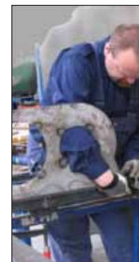
Opspænding af trug