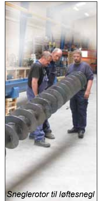
Sneglerotor til løftesnegl

Fordelesystem bestående af to snegle og modtagerbuffer. Komplet levering incl. spjæld og understøtning samt engineering/konstruktion.