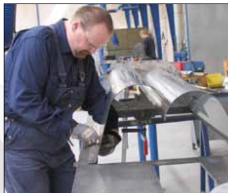
Samling af trugdele til færdigt hus