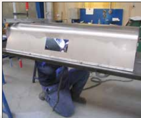
Svejsning af dobbelt snegletrug