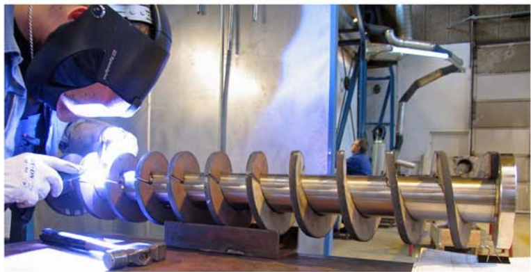
Rotor for ekstruder. I kraftig udførelse.