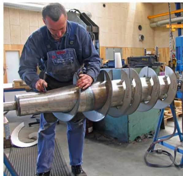
Kvalitet: Alle Vindinger/ seg- menter prøvemonteres på dorn for at sikre at alle mål er korrekte.