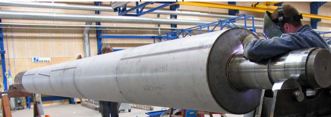
Kernerør beklædes med Duplex kappe