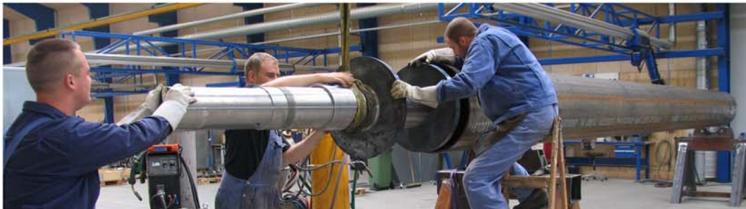
Montage af aksler i kernerør, fremstillet i st.52.