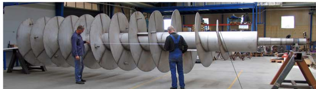
På kappe monteres 12 mm rustfrie vindinger/segmenter. Sneglerotorens første del er konisk og forstærket med bagvedliggende stråttstillet vinding.