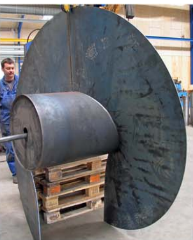
Prøvesegmenter skæres og presses for at sikre korrekt pasform og mål inden de endelige segmenter skæres.